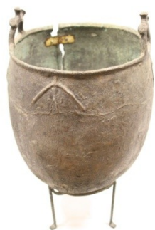
Сурет 9 – көшпелілер қазаны.

Көшпелі қазақтар тұтқасы, тұғыры бар, өз руының таңбасын бастырып шойын , қола қазандар соқтырған. Тұғыры қазанды жерден көтеріп тұратын кішігірім ошақ түрінде бірге құйылған (Сурет 9). Жалағаш музейінде сақталған мосы көшпелі қазақтардың жол жүргенде шәйнек, ас қайнату үшін қолданған жиналмалы үш аяқты құрал (Сурет 10), үш аяқты қосып тұратын шеңберіндегі ілгішіне шәйнек (Сурет 11) немесе тұтқасы бар шағын қазан ілген. Мосыға ілуге ыңғайлы шәйнек пен қазанды жеңіл етіп жезден соққан. Мосыға тұрмыста жез елек іліп, дәнді қабық, кермегінен тазалау үшін де қолданған [25, с.233], (Сурет 12 а,б).