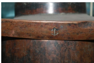
Сурет 11 – тұтқасына ру таңбасы шекілген шәйнек және оның фрагменті.