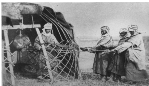
Сурет 3 – Арқан есу. «Түркістан альбомы» үшін 1871 жылы Л.Кун түсірген [14].

Шүйкелерді септеп, селбестіре отырып дайындаған тіннің үшеуін кереге көзінен өткізіп, олардың әрқайсысын 5 – 6 метрдей жерге апарып, ұштарын ағаш кесіндіге орайды да, үш адам үш тіннің барлығын бір бағытқа қарай тартыңқырап тұрып бұрайды. Арқан тіндерін әбден шиыршықтыру керек, қолының күші бар бір адам үйге кіріп, тіндердің айқасқан тұйық түбіне бір – екі тілдей жіп өткізіп алып, өзіне қарай тартып, шиыршықты бағытына қарай бұрап тұрады. Арқан сапалы шығу үшін әрбір тін бірдей ширауы керек. Үй ішінде жұмырланып тартылған арқанның ұшын керегенің көзінен сыртқа шығарып, тартылған арқан ұштары түйіп байланады, мата қиындыларымен бекітіп тігіледі. Дайын болған арқанды екі қазыққа керіп орап тастап, біраз уақыт шиыршықты қанғаннан кейін пайдаланады. Сыр өңірінде арқан есуді арнайы бір адам кәсіп етпеген, арқан есу үй кәсіпшілігінде дамыған [VIII]. Ал Ә.Диваев арқаншы кәсібінің болғандығын жазып кеткен [1], бірақ жергілі дерек берушілер арқан есу үй кәсіпшілігі ретінде дамып, оның әдісін әрбір қазақ меңгергендігін айтады. Желі арқан – Мал сауу үшін отбасылық малдарының төлдері мен енелері байланатын, арнайы керілген арқанды желі арқан дейді. Желі арқанның яғни желінің бұзау желісі, құлын желісі, бота желісі сияқты түрлері болады. Желінің қозы көгендеуге арналған түрі көген , қозының басына кигізілетін бөлігі бұршағы деп аталады. Сыр өңірі қазақтардың арқан есу сәтін 1870 жылы А.Кун, одан кейін ауыл шаруашылығы санағы кезінде статистар түсіріп алған [13-14] (Сурет 3-4).