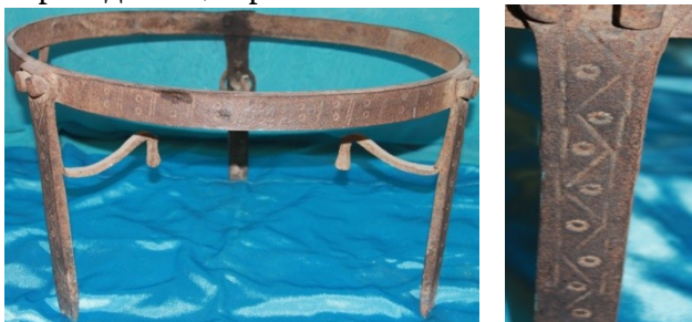
Сурет 7 – ошақ және оның фрагменті.

қалауына қарай қадаубас қалыптармен шекіп, ойып ою-өрнек түсірген (Сурет 8). Ошақ халық даналығында киіз үй ішіндегі ерекше құрметке ие болған ортадағы ошақ қасиетті орын деп саналды. Отағасының қаза болуы немесе ұрпақтың болмауы - от басының құруы, ошақтың сөнуі, ұрпақ-түтін түтетуші деген ұғымдардың қолданылуы бекер емес. Ошақтан шыққан күлді шашуға, үстіне отын жаруға, қоқыс тастауға тыйым салынады. Әйтпесе от басына ауру, бақытсыздық келеді деп ырымдап отырған [2]. Ошақ қыстың күні киіз үйдің ортасына орналастырылып, айналасына откиіз төселген, қалған уақытта далада құрылған. Қазақ дүниетанымында қазан мен ошақтың ортада орналасуы, өмірдің қайнар көзінің белгісіндей болған. Қысқы суықта жылылық пен нәр берген [2]. Ошақтартарға шекілген қазақы ою-өрнектер ұсталардың ошақ соғуға ерекше мән бергендігінің көрінісі.