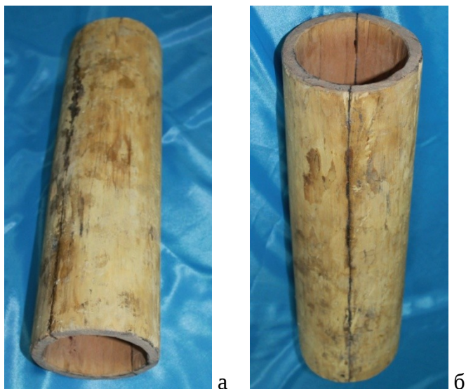
Сурет 14 – шығыр шелегі. Реконструкция.