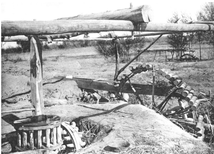
Сурет 15 – шығыр. Перовск уезі, Царская болысы. А.Фишер түсірген, 1910 жыл [13, с.80].

Шығыр жасау үшін жуандау келген ағашты дөңгелектете қиюластырып ойып алған соң, оның шет-шетін шауып тіс жасайды. Ортада болатын дінгекке жас талдан иілген үлкен шеңберді бекітеді. Мықты ағаш жиде, тұт ағашынан жасалған доңғалақ шеңберге ішіне екі литрге дейін су кететін қырыққа жуық шығыр шелектерін байлайды. Шығырдың қасына «әуіт» қазады да, суды сыртқа шығару мақсатында дінгек пен әуіт ішіндегі шекелік ағаш бір-біріне байланыстырылып бекітіледі. Ал үздіксіз құйылып тұратын су арықпен кетіп жататын. Сондай-ақ шығырдың су құятын ыдысы теріден немесе басқа материалдардан да жасалынатыны бар. 1916 жылы Шіркейлі каналында 144 шығыр болып, оның көмегімен 259 десятина жер суарылған [21, с.26]. Қазалы уезінде көптеген егістіктер де шығырлар мен атпалар көмегімен суарылды. Шығырлар жағасы биік арықтар бойына орнатылып, түйе, болмаса жылқы көмегімен қозғалысқа келтірілді. Ат шығыр мен қол шығыр негізінен осы Сырдария бойы мен Аралмен шектесетін Қазалының батыс өңірінде кеңінен қолданылды.