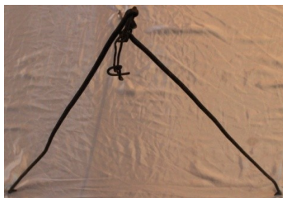
Сурет 10 - мосы.