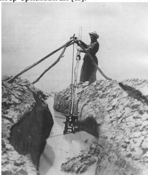
Сурет 16 – атпа. «Түркістан альбомы» үшін 1871 жылы Л.Кун түсірген [14].

Арнасы жерден онша биік емес арықтар бойындағы егісті суару үшін сабы үш аяқты мосы аспаға ілінген су шығарушы гидротехникалық құрал атпаны қолданды. Су көтеретін атпаның жан-жағы бүгілген күрек басына ұқсайтын қондырғысы ұзын ағаш арқылы су астындағы тезге бекітіліп, арықтағы суды егістікке қарай көтеріп тұрды. Атпа мосының екі жағы тең етіліп, сырық орнатылады да, оның бір басына күбі - шелек, екінші басына ауыр нәрселер (зат) байланады. Ауыр нәрсе байланған жағы жоғары көтерілгенде, күбі шелек төмен түсіп, оған су толады. Ал ауыр зат төмен түскенде яғни басылғанда шелек жоғары көтеріліп, ішіндегі су арыққа төгіледі. Атпаның жұмысы негізінен адам күшімен іске асады (Сурет 16). Өкінішке орай жергілікті музейлерде шығыр мен атпаның түрнұсқасы сақталмаған. Шығыр арқылы су көтеруге қыштан жасалған құмыра орнатуды Сырдың ортаңғы ағысы тұсына қарай Жаңақорған өңірінде, яғни Оңтүстік Қазақстанмен шекараласатын тұсында ғана қолданған, ал Сырдың төменгі ағысы бойында тек ағаш шелектер орнатылған [II].